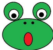
Ziewnij i otwórz szeroko buzię.