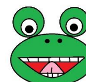
Dotknij czubkiem języka górnych zębów.