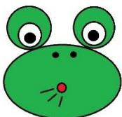
Wypuść powietrze przez usta.