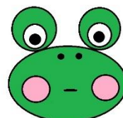
Nabierz powietrze w policzki.