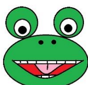
Dotknij czubkiem języka dolnych zębów