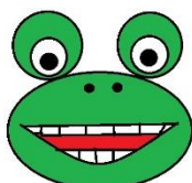
Uśmiechnij się i pokaż zęby.